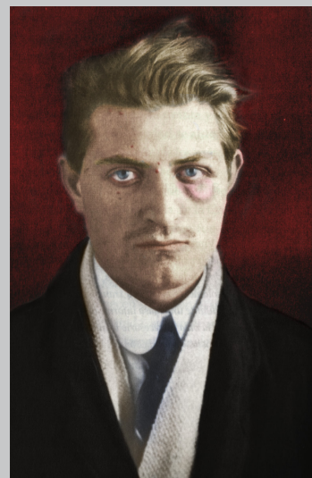
Severino Di Giovanni

“Los bellos cantos a las masas activas, laboriosas, pujantes: los himnos a los músculos vigorosos: las aladas peroraciones al trabajo que enoblece, que eleva, que nos libra de las malas tentaciones y de todos los vicios, no son más que puras fantasías de gentes que nunca han tomado el martillo ni el escalpelo, de gentes que nunca han encorvado el lomo sobre un yunque, que jamás se han ganado el pan con el sudor de su frente.”